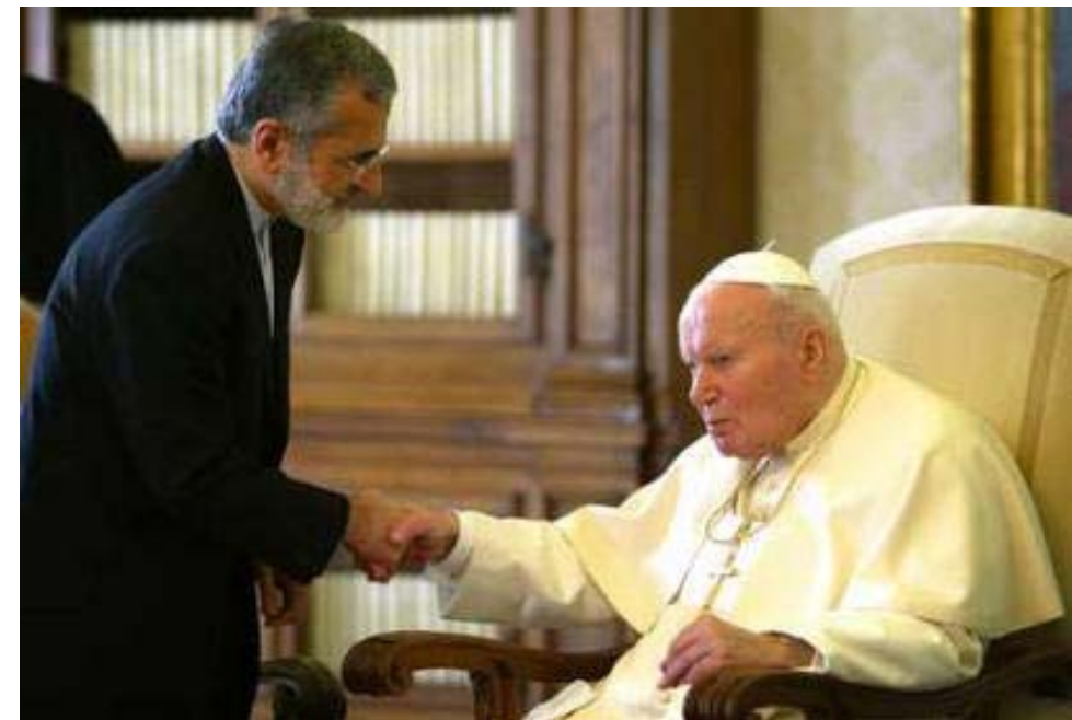
Papa saluda al Ministro de Relaciones Exteriores de Irán Kamal Kharrazi; en su biblioteca del Vaticano, el 12 de Febrero del 2004.