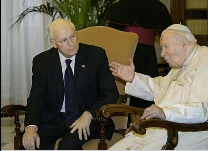
U.S. Vice President Dick Cheney meets with Pope John Paul II, at the Vatican on Tuesday, Jan. 27, 2004.

mará a hombres, como en antaño llamó a los humildes pescadores, El mismo les dará la educación que El desea que tengan. El llamará a hombres, del arado y otras ocupaciones para dar la última nota de advertencia a las almas que perecen". (The Publishing Ministry, p. 278).