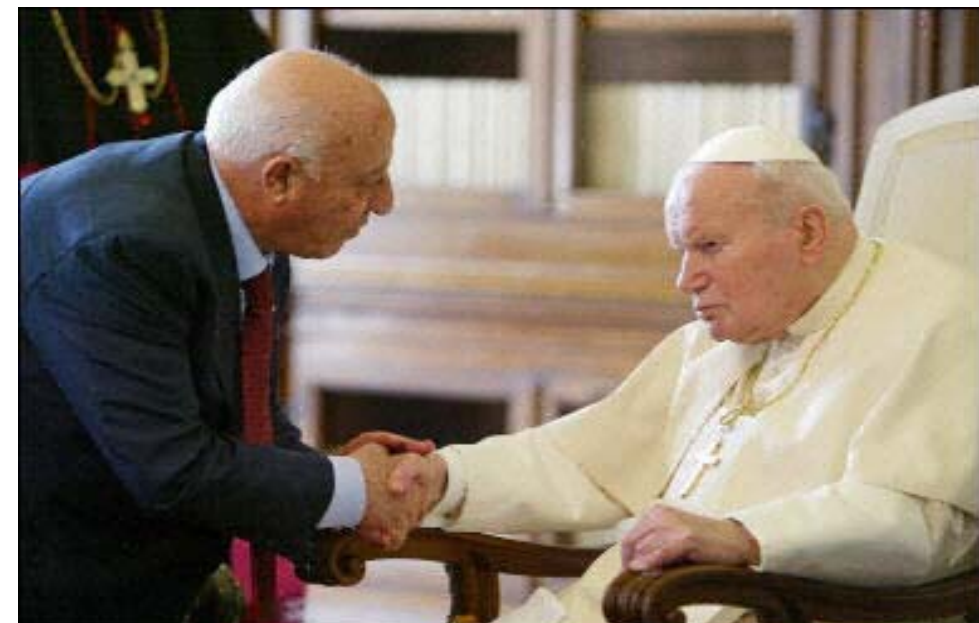
Papa Juan Pablo II saluda al Primer Ministro de Palestina Ahmed Qurie, durante una audiencia privada en su biblioteca del Vaticano, el 12 de Febrero del 2004.

mente gobernaba sobre algunas partes de Europa, Asia y África. Hoy, su influencia es mucho más extensa, alcanzado los continentes de Norte, Centro y Sur América, Australia y el sur del pacífico. Verdaderamente, ¡todo el mundo se maravilla en pos de la bestia! Nuestro mensaje es incluso mucho más necesitado hoy que en el pasado. El mensaje del tercer ángel es más verdadero y necesario en esta generación de lo que jamás ha sido. Ahora no es el tiempo de abandonar nuestra posición y regresar, sino de movernos hacia adelante dando "el poderoso y más solemne mensaje de prueba nunca dado al mundo" (Manuscripts Releases, Vol. 5, p. 314). —Los Editores