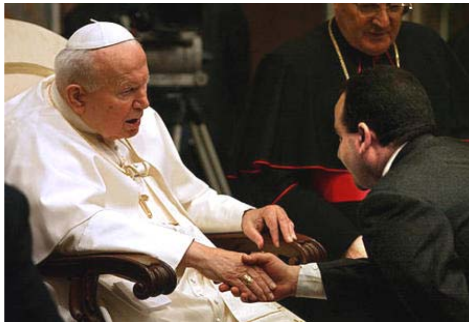
Papa Juan Pablo II saluda al embajador de Irak Al Anbari Abdul Amir, el lunes 12 de enero del 2004 en el Vaticano.

poder deberá ser traído a sujeción. Porque leemos: "Y adoraron al dragón que había dado autoridad a la bestia, y adoraron a la bestia, diciendo: "¿Quién es como la bestia, y quién podrá luchar contra ella?"