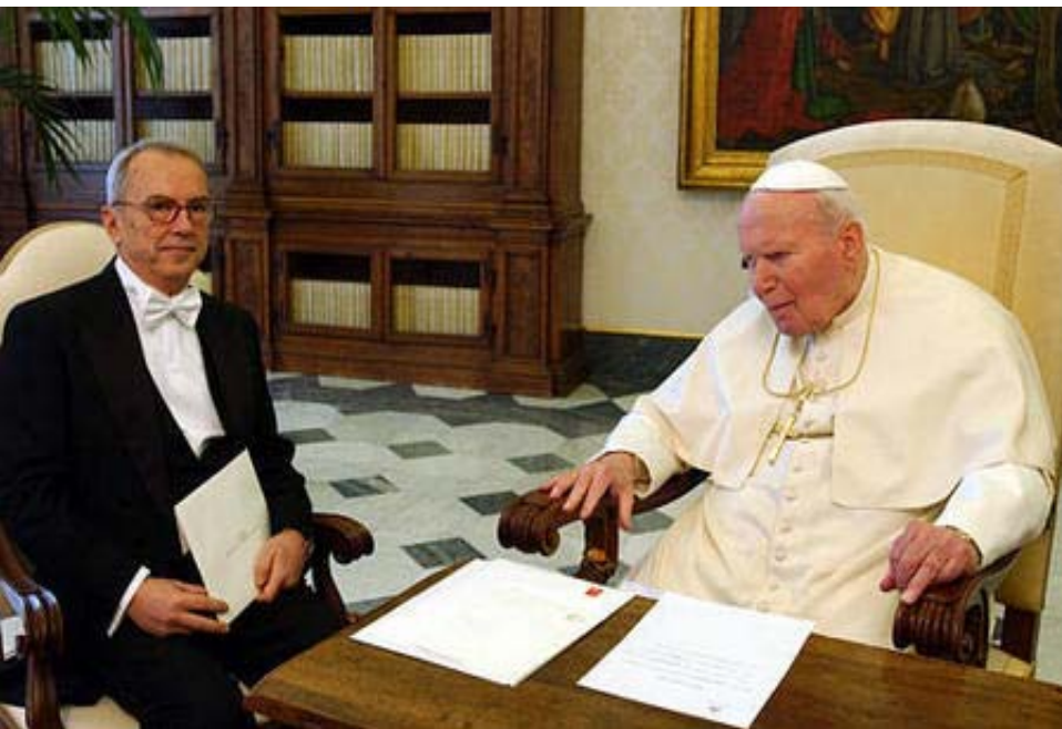
Papa Juan Pablo II se reúne con el nuevo embajador turco para la Santa Sede, Osman Durak; mientras éste entrega sus credenciales diplomáticas al Vaticano. Febrero 21, 2004.

El Vaticano es el más antiguo poder con aspiraciones globales. Sus Papas están convencidos de que tienen derechos divinos para gobernar sobre poderes temporales.