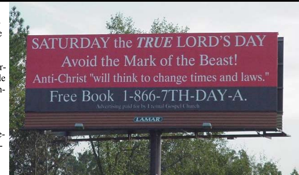
Two Eternal Gospel Church billboards placed here in the USA.