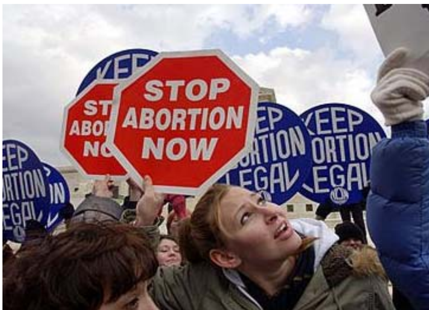
Grupos cristianos y activistas sobre el derecho al aborto reunidos frente a la Corte Suprema de los Estados Unidos.

Reflexione esta situación. Aquí estaba el más cruel, injusto y discriminatorio gobierno de los tiempo antiguos. El sistema de impuestos era muy deshonesto, los programas sociales eran una vergüenza y las reformas para no decir mucho, no se veían venir. Los fariseos asumieron que Jesús iba a desarraigar el gobierno romano. Seguramente El tomaría algún apoyo político aquí. Seguramente El recomendaría alguna legislación para contrarrestar lo malo. Seguramente El reformaría el sistema. Pero Jesús no lo hizo, ¿es Jesús nuestro ejemplo? Si lo es, en-