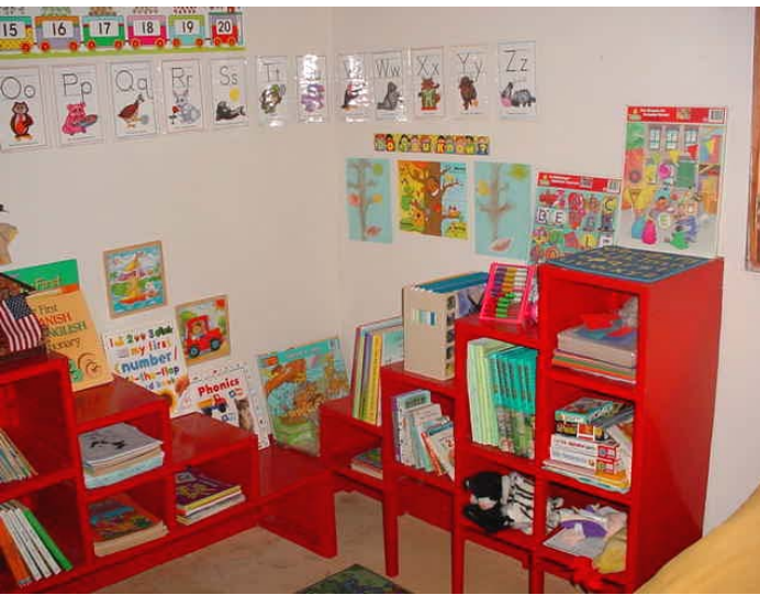
Aquí están los niños, trabajando duro en su aula de clase, en la escuela de hogar.