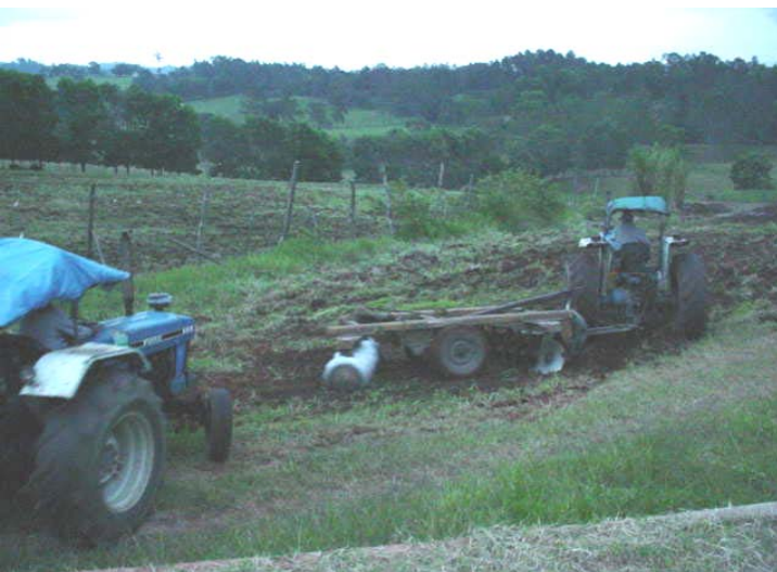
La tierra está siendo preparada para la cosecha del siguiente año.