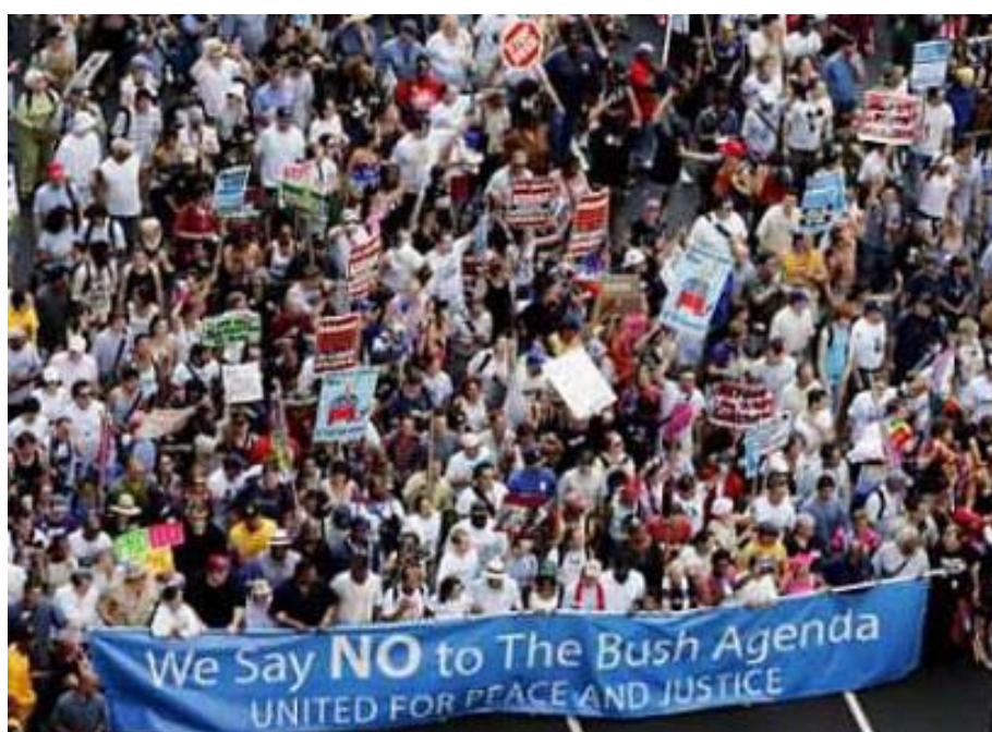
Ciudadanos ejercitando su derecho de pedir al gobierno la solución de sus injusticias. Los protestantes marchan en frente del Madison Square Garden, sitio de la Convención Republicana Nacional, en New York, el 29 de Agosto, 2004.

Incluso después de estos ejemplos tan significativos de la pluma inspirada, los ASD no seguirán aun el ejemplo del Señor, y ellos justificarán su desobediencia clamando de que ellos son seguidores del ejemplo de A.T. Jones. Pero esto no