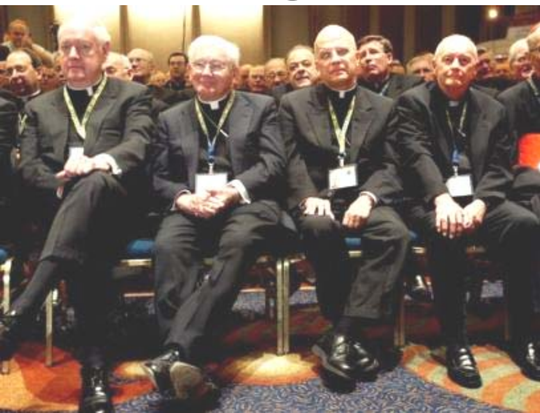
El máximo jerarca de la Iglesia Católica Romana en América estuvo presente durante el discurso del presidente. [de izq. a der.] Cardenal Egan de New York, Cardenal Keeler, Baltimore, Cardenal George, Chicago y Cardenal McCarick, de Washington, D.C.

Catholic World News, 4 de agosto del 2004. — En su discurso del 3 de agosto en la convención de los Caballeros de Colón en Dallas, el Presidente George W. Bush puso de manifiesto un llamado a su campaña a lo americanos católicos, los cuales pudieran formar un bloque crucial de votación en este año de elección presidencial.