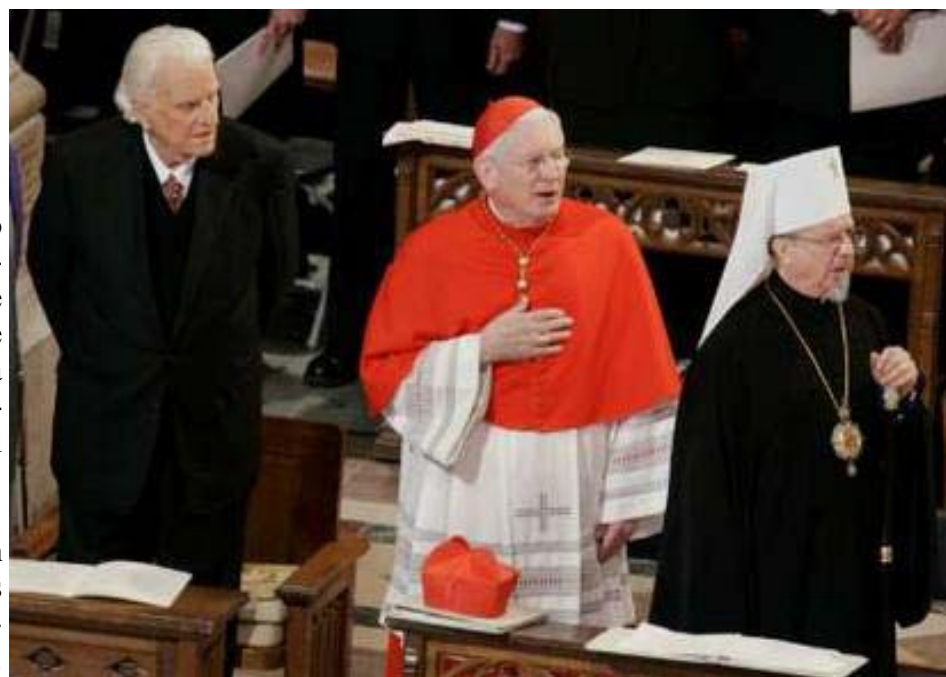
Billy Graham(izq.) fue colocado junto al católico romano Cardenal Keeler, el Arzobispo de Baltimore (centro) y el Arzobispo de la Iglesia Ortodoxa de América Herman Metropolitan; durante el servicio de oración en la Inaguración Presidencial, el 21 de enero del 2005, en Washington, D.C.

El evento de esta mañana incluirá a pastores de diferentes credos religiosos y de diferentes lugares del país. El Evangelista Billy Graham estará entre esos del púlpito. Este será el octavo servicio de oración inaugural dirigido por Graham, aunque faltó al último por razones de salud.