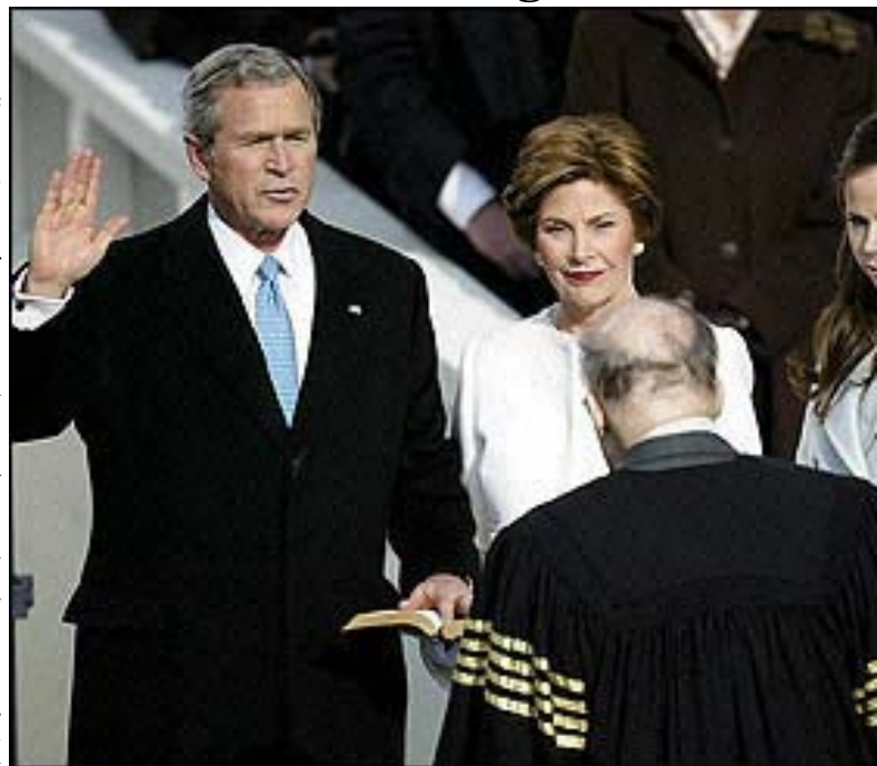
El Presidente George W. Bush, con una mano sobre la Biblia, tomando del Juez de la Suprema Corte de Justicia, William Rehnquist, el juramento de su oficina; durante la ceremonia de inauguración en el Capitolio, el 20 de enero del 2005, en Washington, D.C.