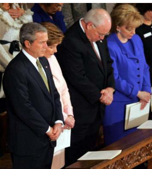
El Presidente Bush con la primera dama Laura Bush, el Vicepresidente Richard Cheney y su esposa Lynne.