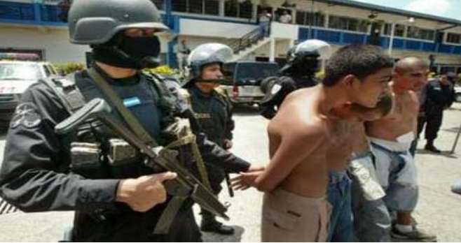
Miembros de una pandilla son escoltados después de ser capturados por policías en San Salvador, el 8 de sept. del 2005. Autoridades anunciaron que la Operación AntiMaras Simultáneas Internacionales las cuales operan en cinco diferentes países – México, Guatemala, el Salvador, Honduras y Estados Unidos – han atrapado a unos 660 sospechosos.