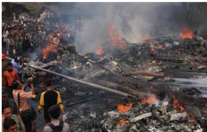
Residentes y oficiales de seguridad se reúnen cerca de los restos de un avión Boeing 737 de la aerolínea de Mandala, el cual se estrelló en Medan, al norte de Sumatra, Indonesia, el lunes 5 de sept. del 2005. El accidente ocurrió en una área residencial de la ciudad de Medan poco después de despegar, matando 147 personas a bordo y un número desconocido en tierra, dijeron los oficiales.