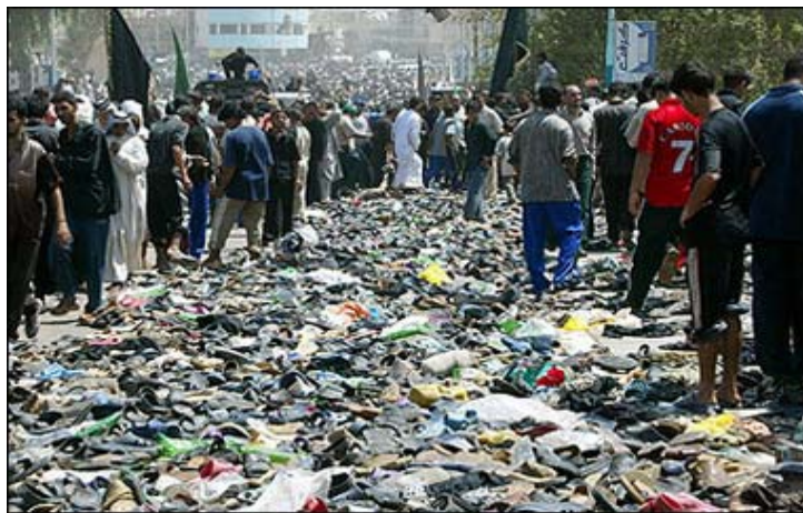
1ro de sept. del 2005 — Iraquíes caminan entre zapatos perdidos que fueron dejados por cerca de 1,000 de sus ciudadanos, que fueron ahogados o aplastados a muerte en una estampida sobre un puente de Bagdad, debido a que una multitud de peregrinos shiitas entraron en pánico por rumores de que habían bombas suicidas en medio de ellos.