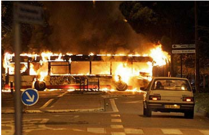
8 de nov. del 2005 – Más de 300 motines estallaron en ciudades y pueblos a través de Francia debido a la muerte de dos jóvenes musulmanes que eran perseguidos por la policía. Vehículos, iglesias, escuelas, hospitales y negocios fueron quemados. El desasosiego civil trajo recuerdos de escenas similares representadas durante la Revolución Francesa. En un espacio de tres semanas, los jóvenes quemaron 9,071 vehículos en un motín nocturno que dejó 126 oficiales policías heridos, indicó el Ministro de Interior. Aproximadamente 3,000 jóvenes fueron arrestados.