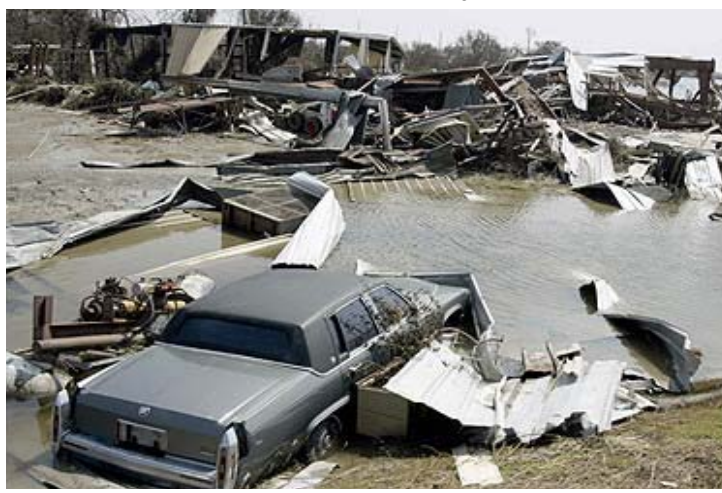
7 de oct. del 2005 — El número oficial de muertos por el huracán Katrina sobrepasó los 1,000 el viernes. El Dept. de Salud y los hospitales reportó que los oficiales de estado habían recobrado 1,003 cuerpos, 15 más de los que fueron reportados el jueves. El incremento de muertos aumentó a 1,242. Katrina mató a 221 personas en Mississippi, 14 en la Florida, 2 en Georgia y 2 en Alabama.