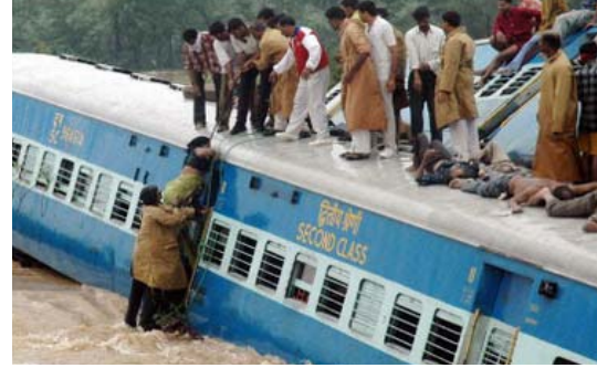
2 de nov. del 2005 – Unas 150 personas murieron cuando siete coches de un tren de pasajeros se descarriló en la parte sur de India, después que un puente colapsara debido a las fuertes lluvias, dijo un oficial del tranvía.