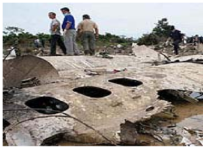
16 de agosto del 2005 — Una avión de una aerolínea Colombiana se estrelló en un área remota de las montañas de Venezuela, matando a 160 personas que iban a bordo.