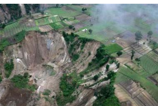
EL total de muertos por los deslizamientos de lodo en Guatemala ascendió a 2,000 personas, cuando los rescatistas dieron por terminada la búsqueda bajo un lodo sólido, después de seis días. El helicóptero muestra una foto de la reciente devastación ocurrida en la zona, la cual cubría un área de 165 kilómetros (102 millas) al oeste de la ciudad de Guatemala, el lunes 10 de octubre del 2005.