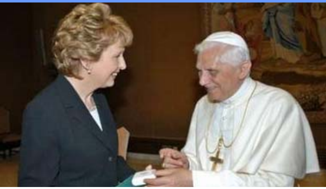
La Presidenta de Irlanda Mary McAlesse se reúne con el Papa Benedicto enseguida de su discurso semanal en la plaza de San Pedro en el Vaticano, el 7 de septiembre del 2005.