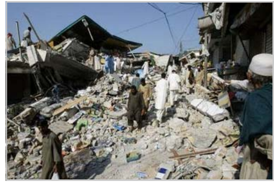
El total de muertos debido a un terremoto ocurrido en Pakistán el 8 de octubre del 2005, fué de unos 87,350; luego de un nuevo conteo. Unas 69,000 personas fueron severamente heridas.

— viene de la pág. 5 tierra. El liberalismo está basado en las ideas del hombre, sus deseos, esperanzas, temores, sufrimientos y dificultades. "Debemos darle al hombre lo que él necesita" es el punto central de este mensaje, desde que ha entrado en las iglesias. Este tema ha sido tan bien aceptado por las principales iglesias, que el mismo Karl Marx no pudo haber escrito mejor plan para la secularización de las instituciones religiosas. Lo que ha pasado desde que estos ideales han sido aceptados en todo o en parte, es que la verdadera oración, fe y misión de la iglesia, han sido reemplazados por la solidaridad humana, el ecumenismo y las alianzas políticas; las cuales eventualmente se volvieron el nuevo tema y punto central de la iglesia.