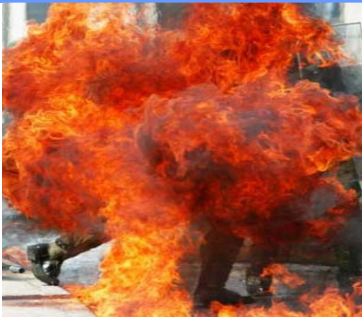
Un Policía chileno anti-motines es atrapado entre las llamas después que una bomba fue lanzada a sus pies por estudiantes universitarios, durante un enfrentamiento en la ciudad puerto de Valparaíso, el 8 de sept. del 2005. aproximadamente 200 estudiantes fueron dispersados por la policía cuando hacían demostraciones previos al 32avo. aniversario del golpe de estado que trajo a Augusto Pinochet al poder.