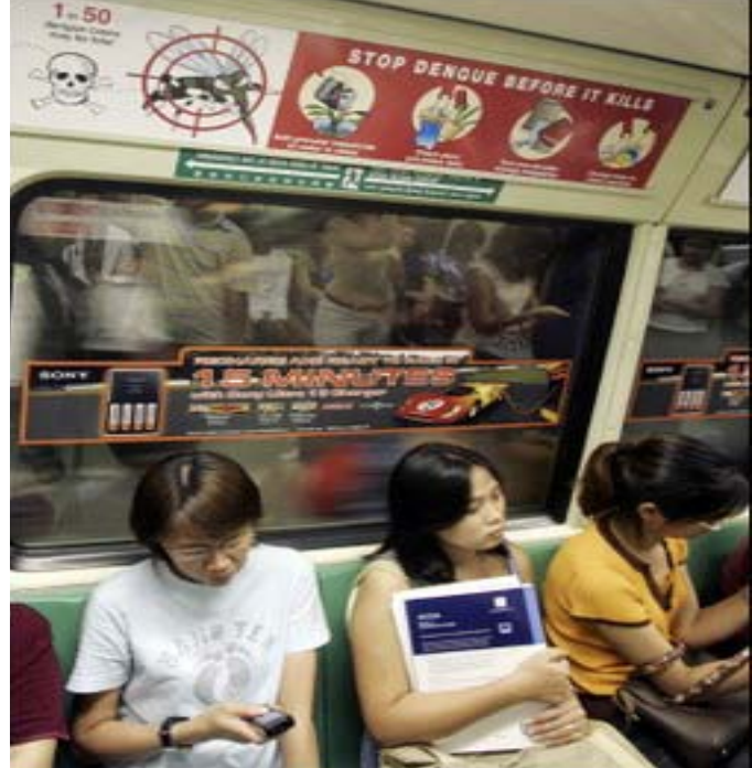
Un letrero que da aviso del peligro sobre el brote del dengue, puede ser leído por los pasajeros que viajan en el tren de Singapur, el 10 de septiembre del 2005. El total de muertes por esta fiebre a llegado al record de 11,000 casos en este año, dijo el ministro de salud.