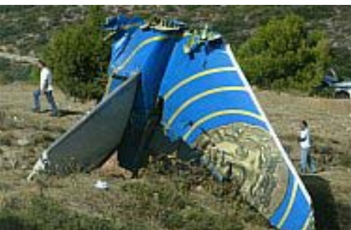
Atenas, Grecia 22 de agosto del 2005. El ultimo hombre en estado de consciencia en la cabina de la línea aérea Cypriot, hizo una llamada desesperada de ayuda dos segundos antes de que el avión con 121 personas, se estrellara contra las montañas cerca de Atenas.