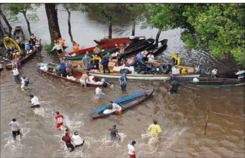
Aldeanos tratando de obtener alimentos distribuidos por el ejército de Guatemala, después del embate del huracán Stan, el 9 de oct. del 2005.