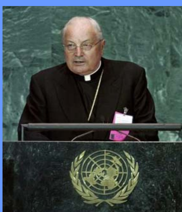
Cardenal Angelo Sodano, Secretario de Estado del Vaticano; en su discurso ante la Asamblea General de la ONU, el viernes 16 de sept. del 2005.

La misión de la ONU para un mundo en desarrollo, está "muy por encima de lo espiritual" dijo el Secretario de Estado del Vaticano. El elogió los esfuerzos por "brindar justicia y solidaridad entre los hombres." También agregó, que la Santa Sede daría su "total apoyo" a las metas de la Campaña para el Progreso del Milenio. En su discurso ofrecido en Francia, el Cardenal Sodano recordó a los participantes que la Santa Sede ha apoyado fuertemente el crecimiento de la ONU; agregando que el Vaticano todavía cree, que la ONU es, "una institución muy necesaria para la paz y progreso de toda la humanidad."