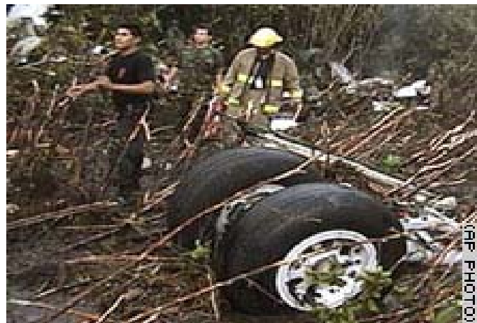
23 de agosto del 2005 — Un avión peruano se estrella en la parte noreste de la jungla del Amazonas, matando al menos 60 personas. Este es el segundo accidente en America del Sur en esta semana, dijo el presidente Alejandro Toledo.