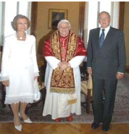
Papa Benedicto XVI posa con el Rey de España y su esposa la Reina Sofía, durante una audiencia privada en su residencia de verano en Castelgandolfo, cerca de Roma; el 5 de sept. del 2005.

“Así también vosotros, cuando veáis todas estas cosas, conoced que está cerca, a las puertas.” Mateo 24:33