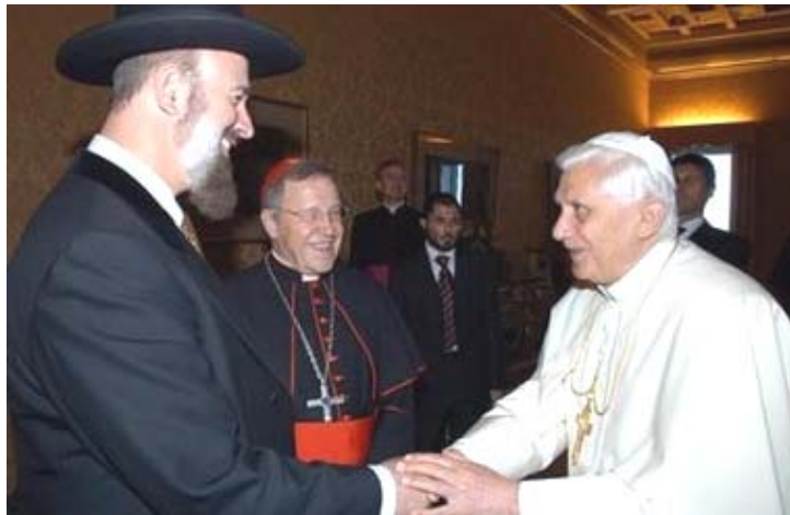
15 de sept. del 2005 — El papa Benedicto XVI saluda al rabino Israelita, Yona Metzger durante una visita privada en la casa de verano del pontífice en Castelgandolfo, Italia. Al centro, el Cardenal Alemán Walter Kasper, del Concilio Pontifical para la Promoción de Unidad.