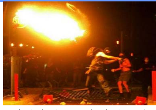
Un huelguista lanza una bomba de petróleo a policías anti-motines durante un encuentro al norte de Tesalónica, Grecia, el 10 de sept. del 2005. Más de 10,000 manifestantes participaron en una marcha en contra de asuntos sobre reformas laborales del gobierno griego.