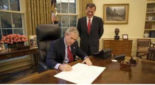
El Presidente Bush, firmando la comisión donde se asigna a John Roberts, un católico romano; como el 17avo. Jefe de la Corte Suprema de Justicia. Este acto se llevó a cabo en la Casa Blanca, el 29 de septiembre del 2005, antes de la ceremonia de juramentación.