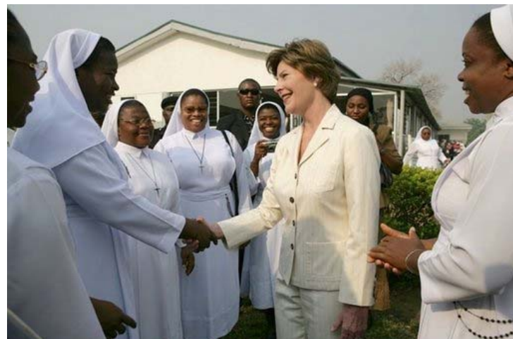
Laura Bush es recibida en el Hospital Católico Santa María en Gwagwalada, Nigeria, el miércoles 19 de Enero del 2006.