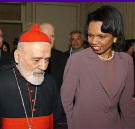
La Secretaria de U.S.A. Condoleezza Rice hablando con el patriarca libanes, el Cardenal Nasrallah Sfeir, líder de la Iglesia Católica Maronita. Sfeir es considerado ser una de las voces mas fuertes contra Siria, y en favor de la democracia.

Beirut, Líbano.- En una visita sorpresa a la azotada Beirut, la Secretaria de Estado Condoleezza Rice, elogió al Primer Ministro del Líbano el lunes, por tratar de contener el conflicto entre la milicia de Hezbollah e Israel, pero hubieron señales de que su visita desagradó a líderes libaneses. El Primer Ministro Fuad Saniora le dijo a Rice que el bombardeo de Israel había hecho “retroceder su país en 50 años” y que llamó por un rápido cese al fuego” dijo su oficina. Y en un acercamiento oficial al orador del parlamento libanés Nabih Berri, quien está junto a Hezbollah dijo que él no alcanzó un acuerdo con Rice, porque ella quería un paquete comprensivo para detener la pelea y menguar la fuerza del Hezbollah, en vez de un inmediato cese al fuego. David Welch, un asistente de la secretaria de estado que viajó con Rice, dijo mas tarde que fue “injusto” decir que las reuniones con Berri habían sido pobres. La visita de 5 días de Rice, con la cual abrió su viaje al Medio Oriente, marcó la primera misión diplomática de alto nivel en el área, desde que el combate estallara 13 días atrás.