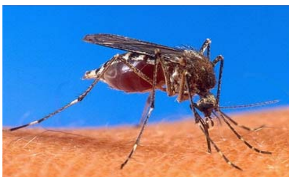
Luckknow, India (AFP) Seis niños más murieron de encefalitis al norte de la India, elevando la cifra a 151, desde que comenzara el brote a finales de Junio. Las autoridades de la India lanzaron una masiva campaña de vacunación a millones de niños contra la encefalitis Japonesa, después que este brote epidémico reclamara 1,400 víctimas el año pasado.