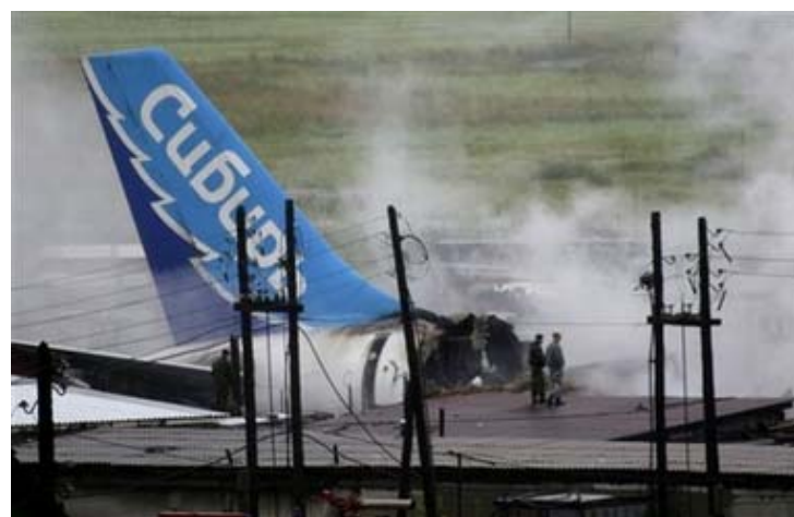
Los restos del avión de pasajeros A-310, llacen en llamas después de estrellarse en la ciudad siberiana de Irkutsk, Rusia, en la mañana del domingo 9 de Julio del 2006. La nave portaba el logo de la línea aérea Sibir en el fuselaje. En este accidente perecieron al menos 102 personas. Las agencias de noticias de Rusia dijeron que el total de muertes podrían alcanzar los 150.