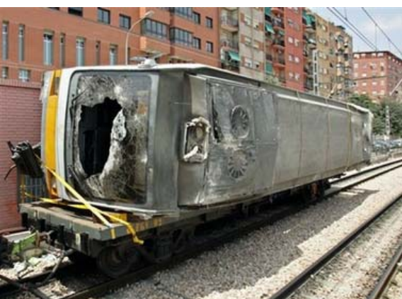
Uno de los vagones del tren que se volcaron el lunes, es sacado de servicio en Valencia, España, el martes 4 de julio del 2006. Los españoles tuvieron 5 minutos de silencio en memoria de las 41 personas muertas, después que se descarrilara el tren..