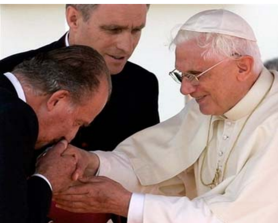
El Rey de España Juan Carlos, a la izq., besa la sortija del Papa Benedicto XVI durante la ceremonia de despedida antes de su partida del aeropuerto de Manises, al final de su visita a la ciudad de Valencia, España, el domingo 9 de julio del 2006.

“Así también vosotros, cuando veáis todas estas cosas, conoced que está cerca, a las puertas.” Mateo 24:33