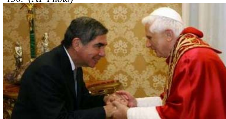
El Presidente Oscar Arias Sánchez de Costa Rica, en su encuentro con el Papa Benedicto XVI en el Vaticano, el 16 de Junio del 2006.