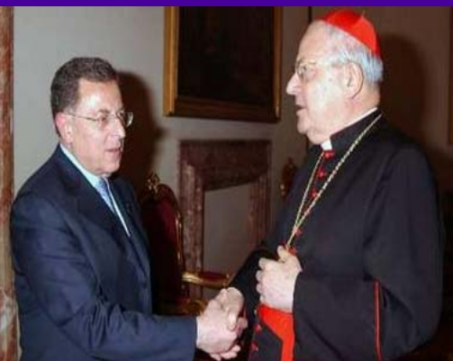
El Secretario de Estado del Vaticano Angelo Sodano estrechando manos con el Primer Ministro del Líbano Fuad Saniora, durante un encuentro privado, en el Vaticano.

CIUDAD DEL VATICANO.- El miércoles, el Líbano se tornó al Vaticano en busca de ayuda para el cese del fuego en el Medio Oriente, enviando al hijo del asesinado Primer Ministro Rafik Hariri, para que se encontrara con el secretario de estado de la Santa Sede. Oficiales del Vaticano dijeron que el Cardenal Angelo Sodano se encontró con Saad Hariri, líder de la mayoría anti-Siria en el parlamento Sirio, cuyo asesinato del padre el año pasado, provocó una masiva protesta que condujo a Siria fuera del Líbano. El encuentro de Hariri con el Primer Ministro Romano Prodi y el Ministro de Relaciones Exteriores Massimo D' Alema, se programó para el jueves. Italia ha estado jugando el papel de lo que Prodi llama “facilitador” en sus esfuerzos por resolver la crisis.