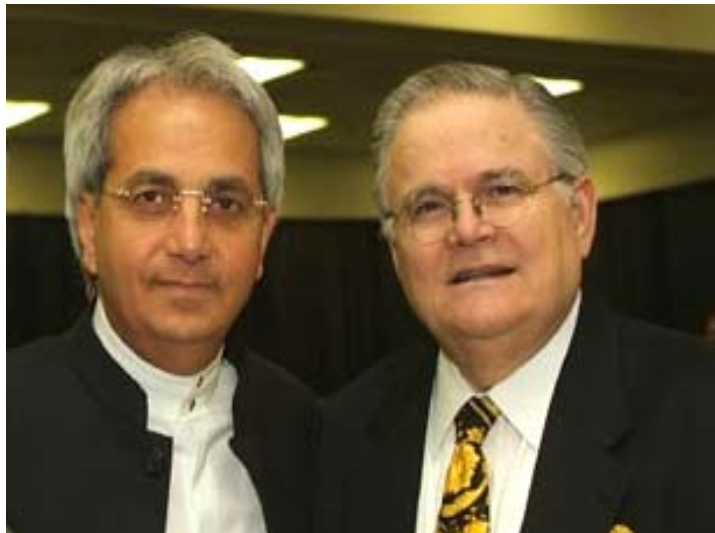
Pastores evangélicos Benny Hinn & John Hagee fueron dos de los principales organizadores de la reunión CUFI.

esfuerzos no han pasado desapercibidos en el extranjero. El diario Israelí Ha'aretz envió a un periodista a San Antonio, el cual escribió un artículo el 5 de Mayo, tildando el esfuerzo de "una magnífica industria evangélica".