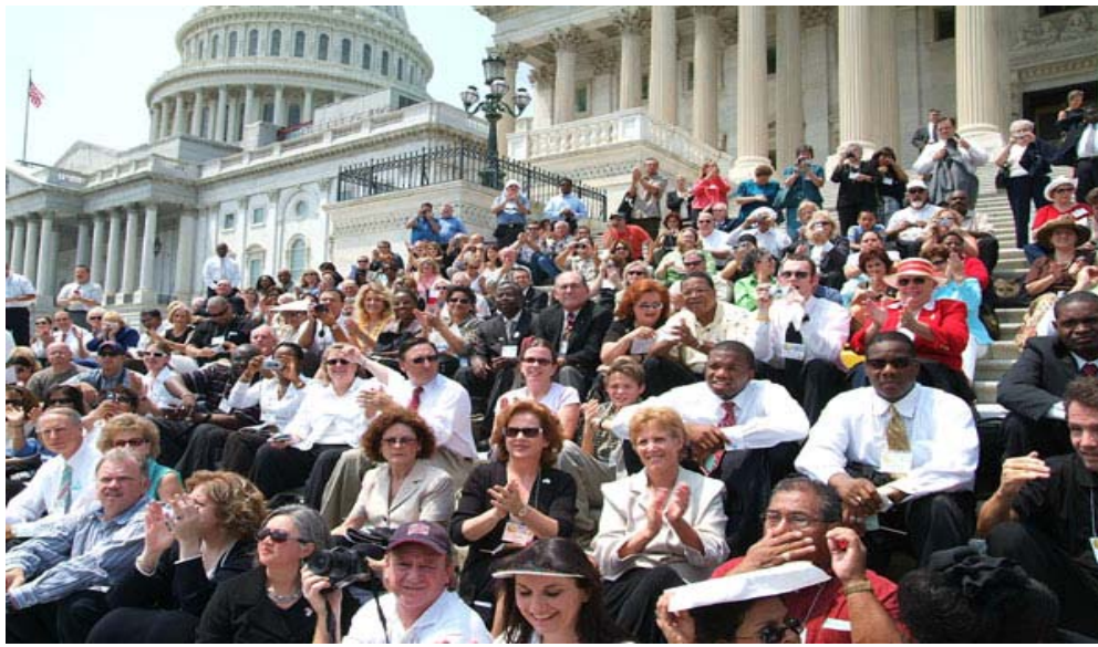
Cerca de 3000 Evangélicos se juntaron en Washington D.C. durante el evento Cristianos Unidos para Israel (CUFI) para hacerle peticiones a U.S.A. en favor de Israel.

CUFI, una organización de cinco meses de antigüedad con origen no comercial en Texas, que mezcla el fervor evangélico con el literalismo bíblico, como su medio organizacional. Su estructura política se distribuye en 50 estados – ordenados por regiones, y ciudades – para reclutar activistas y oficiales elegidos por grupos de presión a favor de Israel. El Sr. Hagee también está organizando una red de "Respuesta Rápida a Israel" de correos electrónicos, faxes y llamadas telefónicas para movilizar a los votantes. Esos