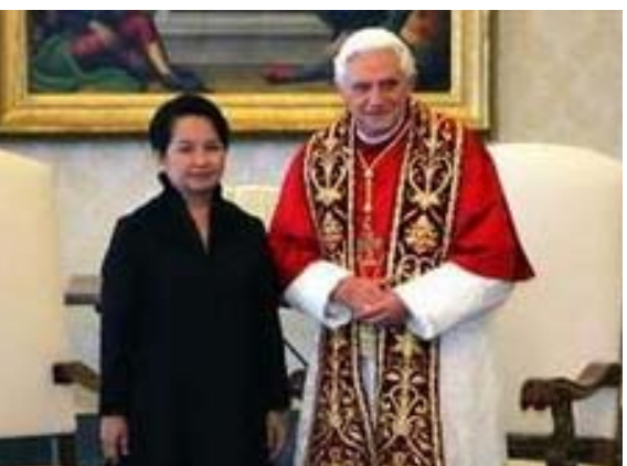
El Papa Benedicto y la Presidente de Filipinas, Gloria Macapagal Arroyo, posando durante una reunión oficial en el Vaticano, el 26 de junio del 2006. Arroyo, se encontraba buscando el poderoso apoyo de los obispos de la Iglesia Católica, al firmar una ley el 24 de Junio, para abolir la pena de muerte en Filipinas, antes de su visita al Vaticano.