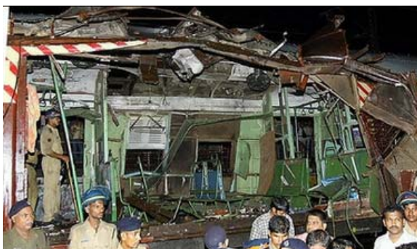
Policías y curiosos se aglomeran alrededor de un destruido tren de pasajeros, que ha seguido a una serie de ataques terroristas, cuyo blanco es atentar contra la principal red financiera de transporte en Mumbai, India. El presidente americano George W. Bush condenó la serie de bombardeos en Mumbai, la capital financiera de India, los cuales ya han reclamado al menos 200 vidas y herido a cerca de 625, agregando que los ataques reforzarían la resolución internacional de confrontar el terrorismo.