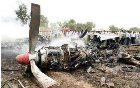
Voluntarios Pakistanos cargando el cuerpo de uno de los pasajeros del accidente aéreo en el Aeropuerto Internacional de Pakistán. El avión envuelto en llamas, se estrelló en el campo minutos después de haber despegado, matando a 45 pasajeros y sus tripulantes..