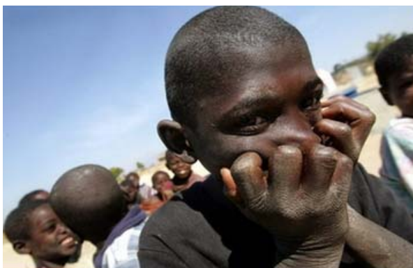
Niños Angoleños se sientan cerca de una bomba de agua en la villa de Liambambo en las afueras de Huambo, en julio del 2005. El total de muertes en Angola por la epidemia del cólera ha llegado a 2,000, excediendo el número de casos a 48,000, dijo la Organización Mundial de Salud (OMS).