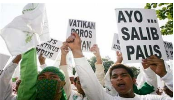
Protesta de musulmanes alrededor del mundo en reacción a las observaciones hechas por el Papa Benedicto XVI sobre el Islam, el 18 de septiembre del 2006. Con letreros como “Crucifiquemos al Papa”, Al-Qaeda ha hecho voto para seguir la guerra santa.