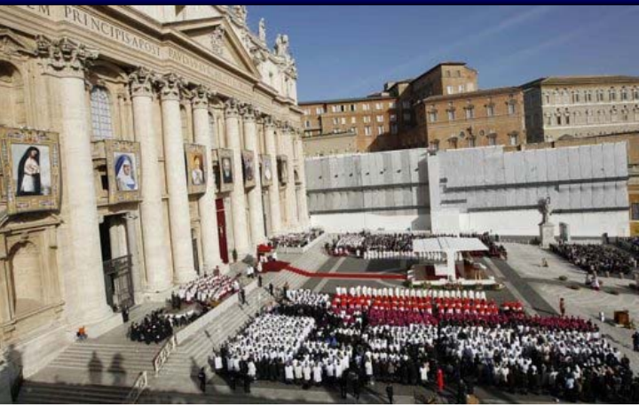
El Papa Benedicto creó siete nuevos santos el domingo 21 de Octubre del 2012, incluyendo a un nuevo Nativo Americano para ser canonizado, como parte de la Iglesia Católica Romana.