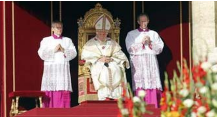
El Papa Benedicto XVI presidiendo una misa especial para canonizar a siete nuevos santos. En su discurso se dirigió a cada uno, para que se tornara a la Virgen María quien es la Reina de todos los santos.