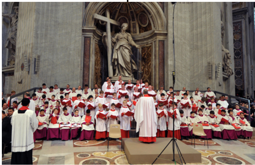
El coro protestante y católico cantando al Papa Benedicto XVI durante la misa papal.