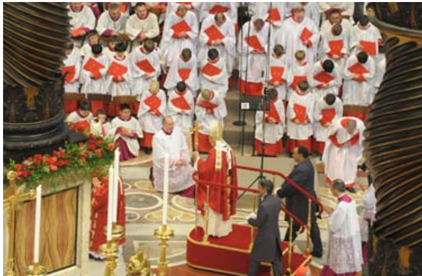
El coro protestante inclinándose ante el Papa en el Vaticano.