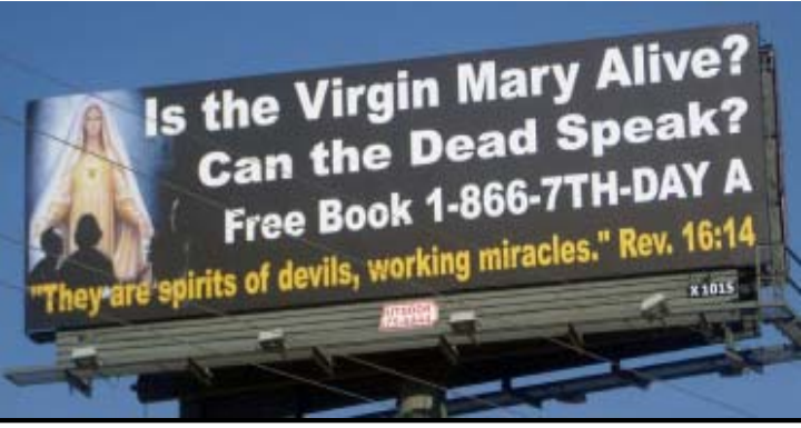
—viene de pág. 1 “Se Acercan las Leyes Dominicales?”