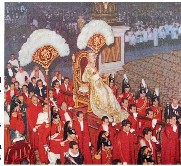
Pius XVII siendo cargado en su trono