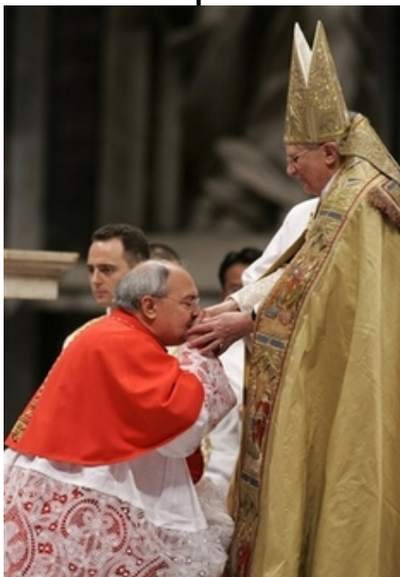
Un cardenal se arrodilla para besar la mano del Papa Benedicto XVI.

Esta es la “abominación desoladora” que Jesús mismo nos advirtió que traerá la ruina final de todo el mundo [Mat. 24: 15]. ¿Debemos suponer que Jesús no entendió la misión de la iglesia remanente? ¿Qué blasfemia sugerir que Jesús se equivocó al llamar la atención de la gente a este poder