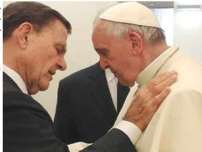
Arriba: Kenneth Copeland, tele evangelista y pastor de una mega-iglesia, pone sus manos sobre el pecho del Papa Francisco y ora con él.

"Los protestantes de los Estados Unidos serán los primeros en tender las manos a través de un doble abismo, al espiritismo y al poder romano ; y bajo la influencia de esta triple alianza ese país marchará en las huellas de Roma, pisoteando los derechos de la conciencia."— El Conflicto de los Siglos , p. 645.