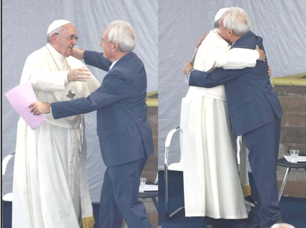
El Papa Francisco abraza al pastor evangélico Giovanni Traettino de una mega-iglesia en Roma, Italia. ¿Las viejas heridas finalmente sanaron?

—viene de pág. 1 “Evangélicos Incapaces de Resistir el Poder Papal”