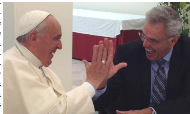
Abajo: El tele evangelista y pastor de una mega-iglesia, James Robinson, choca las manos con el Papa con alegría y emoción.

Cada día parece que cada vez más los líderes protestantes se están alineando para reunirse con el Papa. Los evangélicos están yendo a Roma, no sólo para reunirse con el Papa, sino para relacionarse con él, tocándolo, riéndose y conversando. Esto es lo que la profecía declaró que sucedería. La Reforma Protestante ha recorrido el círculo completo—desde huir de Roma por sus vidas con temor piadoso a huir a Roma con los ojos llorosos y humillados. "Roma nunca cambia," dice el libro Eventos de los Últimos Días , p. 133. Los evangélicos protestantes no tienen ni idea en lo que se están metiendo. Estos son los mismos tipos de abrazos y besos que le fueron dados a Cristo el día en que fue traicionado.